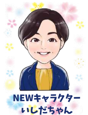
NEWキャラクター いしだちゃん