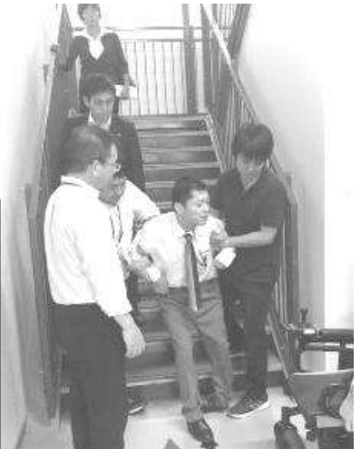
議長、部長との意見交換 は2階の会議室でした。 全職員が車いす対応研修 をされているのに、電動 車いすごと抱え上げよう とされたので、重すぎて 危険なことを伝え、歩か せて頂き昇り降りしまし た。庁舎担当者が「怖い、 怖い」と言いながら介助 されたのが印象的でした