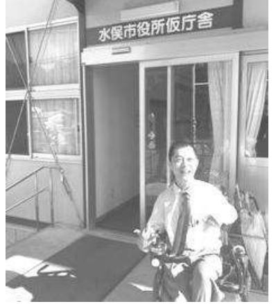
仮庁舎の入口で撮影。リ ース物件のため改修で きないとの説明でした が、なぜか後付けでスロ ープがついていました。

できない理由ばかりでしたが、これについて私の見解ですが、 ①市民からの要望はある ②職員研修の徹底をしているとのことだが、職員研修はこれまでたつた4回しか実施しておらず、今後の予定は未定である ③神奈川県の時プレハブ仮庁舎には、エレベーター設置事例がある ④抑々設置すべき設備であり、「追加の投資」と考えることではない。 つまり、できる理由はたくさんあります。 新庁舎の供用開始は令和3年の11月を予定しており、障害者や高齢者、ベビーカーなどあと2年間も不便を強いられることになり、市民全員が使いやすい市役所になるよう利便性も含め、早期に昇降設備を設置するよう、12月議会の一般質問にて訴えました。 また、市民団体も発足し、1月17日に水俣市長へ要望書と署名の提出を行います。 一般質問動画 https://www.youtube.com/watch?v=iwfyIv7t7JI&t=266s