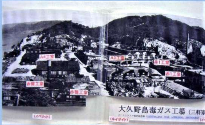
大久野島毒ガス工場 (三軒家)