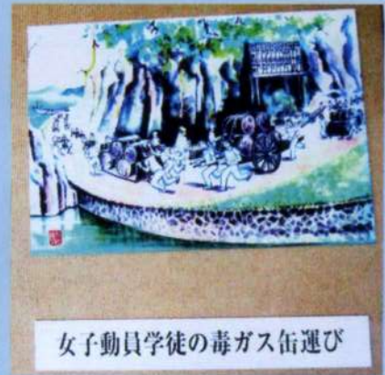
女子動員学徒の毒ガス缶運び