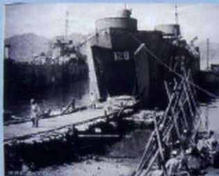
敗戦時、大久野島の毒ガスは太平洋に遺棄された。