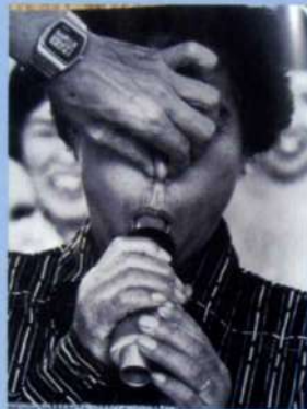
毒ガスの後遺症で苦しむ毒ガス傷患者