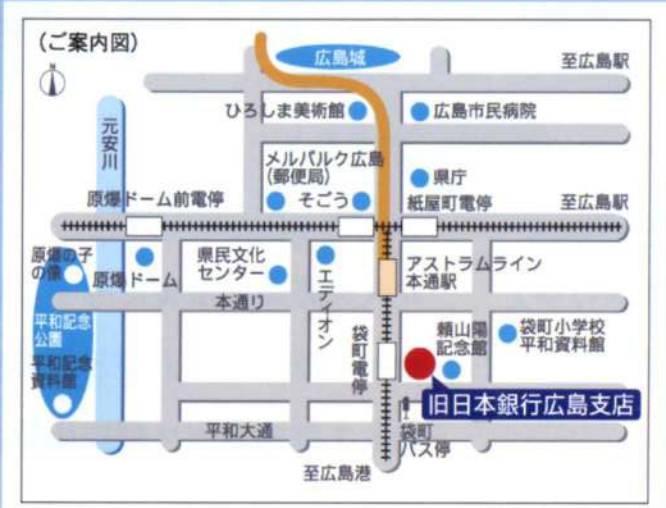
旧日本銀行広島支店 住所・地図