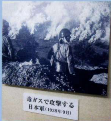
毒ガスで攻撃する日本軍 (1939年9月)